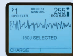
See-Thru CPR filtra el artefacto de la compresión. Lo que reduce el tiempo sin compresiones a la vez que comprueba que se haya desarrollado un ritmo organizado que permita la descarga.

See-Thru CPR® filtra el artefacto de compresión ("ruido") para que pueda ver el ritmo cardiaco subyacente del paciente (ECG) mientras realiza la RCP. Las pausas son inevitables, pero la reducción del tiempo sin compresiones da lugar a una mayor fracción de compresión torácica (CCF), la proporción de tiempo empleado en hacer compresiones durante la RCP. Una mayor CCF predice posibilidades superiores de supervivencia en pacientes con parada cardiaca fuera del entorno hospitalario. 4