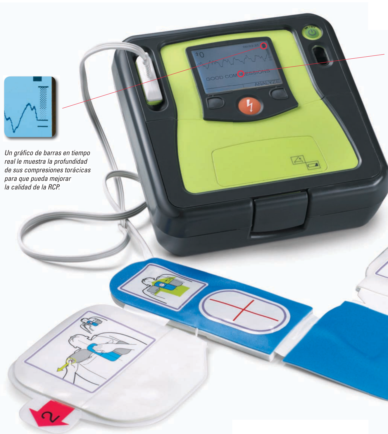
Un gráfico de barras en tiempo real le muestra la profundidad de sus compresiones torácicas para que pueda mejorar la calidad de la RCP.

De acuerdo con las normas 2010 de la American Heart Association, "la tecnología de indicaciones sobre la RCP e información en tiempo real como los dispositivos de aviso visual y sonoro pueden mejorar la calidad de la RCP". 1 El AED Pro® de ZOLL® ofrece la información que necesitan tanto los reanimadores profesionales como legos para realizar una RCP óptima.