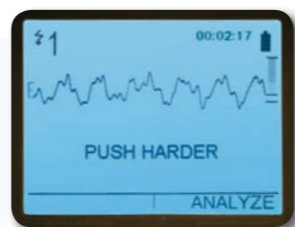
Si sus compresiones torácicas en la RCP son poco profundas, el dispositivo le indicará "Presionar más fuerte".

Real CPR Help® ofrece información en tiempo real tanto sobre la profundidad como el ritmo de compresiones torácicas para mejorar la calidad de la resucitación RCP. De hecho, de acuerdo con un amplio estudio realizado en hospitales, los asistentes mejoraron hasta cinco veces la calidad de sus compresiones RCP utilizando Real CPR Help. 2 La pantalla muestra también una ayuda tipo metrónomo que le guía con mensajes visuales y sonoros para lograr niveles de compresión homogéneos. Un mensaje de "Buenas compresiones" refuerza la alta calidad de las mismas.